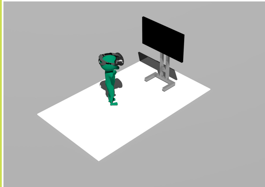
ESQUEMA DE MONTAJE CON PANTALLA DE PLASMA

Espacio nivelado de 3 x 2 metros Toma de corriente a 220V y 3600W de potencia. Lugar cubierto para proteger los equipos.