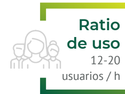
Opción 1: un puesto de actividad