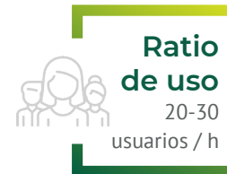
Opción 1: un puesto de actividad