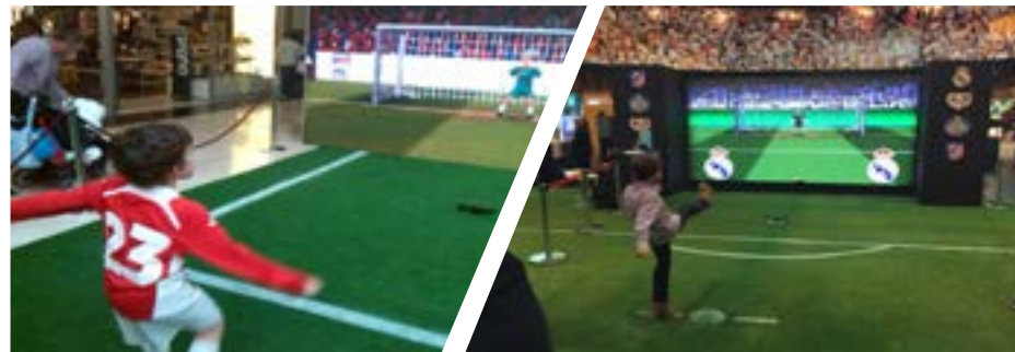
Imágenes de eventos realizados

Dentro del simulador, pueden personalizarse la cara y camiseta del portero y los espectadores, los logos y vallas publicitarias, así como configurar el porcentaje de acierto de los disparos a puerta.