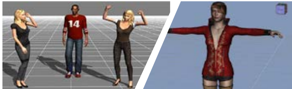
Imágenes de la aplicación

Los participantes podrán interactuar con un avatar en pantalla, pudiendo personalizar su aspecto, y luego moverlo a nuestro antojo. También podremos elegir el escenario en el que se mueva nuestro avatar. El sensor detecta nuestros movimientos y los envía a través de un software a la pantalla, pudiendo ver el resultado.