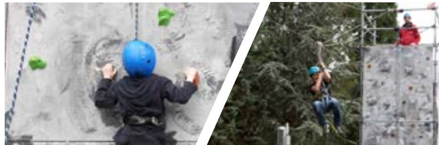
Imágenes de eventos realizados

También se puede completar la actividad con un segundo rocódromo.