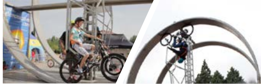
Imágenes de eventos realizados

El Looping Bike consiste en dos aros en los que, gracias a un sistema de contrapesos, los usuarios pueden girar y alcanzar hasta siete metros de altura. Los aros están situados en una plataforma que se eleva unos 70 centímetros del suelo. Los participantes tendrán que avanzar por los 360° de la plataforma gracias a sus pedaladas. Irán sujetos por un arnés.