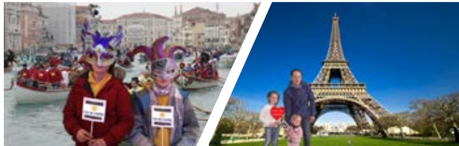
Imágenes de eventos realizados